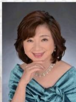
藤井博子 / メゾソプラノ