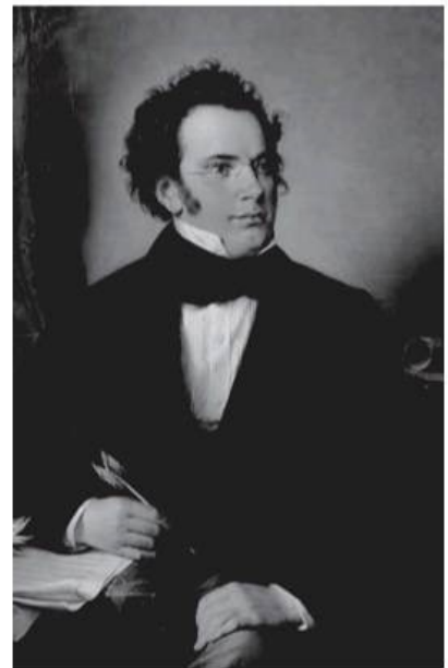
フランツ・シューベルト (1797～1828)

旧アンサンブル・アート・オブ・フーガのコンサートマスター、京都新祝祭管弦楽団のコンサートマスター、京都市立京都堀川音楽高等学校、滋賀県立石山高等学校音楽科の非常勤講師を経て、現在、神戸女学院大学音楽学部非常勤講師、教え子を中心として結成されたフォーノ・リッコ・アンサンブル京都を主宰している。