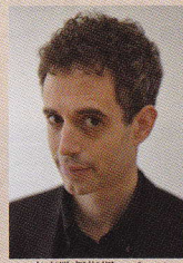
音楽監督指揮・ピアノ パブロ・エスカンデ

指揮/ピアノ・・・パブロ・エスカンデ ピアノ・・・三橋桜子 合唱・・・14人の天使合唱団、こどもたちの合唱団 全員合唱