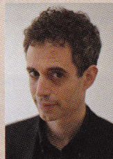
音楽監督指揮・ピアノ パブロ・エスカンデ

指揮/ピアノ・・・パブロ・エスカンデ ピアノ・・・三橋桜子 合唱・・・14人の天使合唱団、こどもたちの合唱団 全員合唱